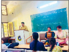
मिवानी। छात्रों को संबोधित करते वकता।