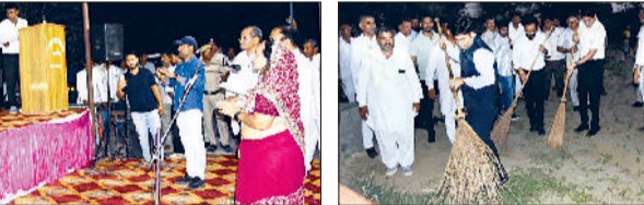
मिवानी। आयोजित रात्री ठहराव के दौरान लोगों की शिकायतें सुनते उपयुक्त व स्वच्छता अभियान की शुरुआत करवाते उपयुक्त।