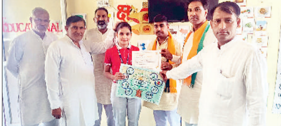
तोशाम। देव पब्लिक स्कूल के प्रतिभागियों को सम्मानित करते हुए।