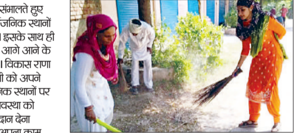
मिवानी। टिकाणकला में सार्वजनिक स्थानों की साफ सफाई करती महिलाएं।