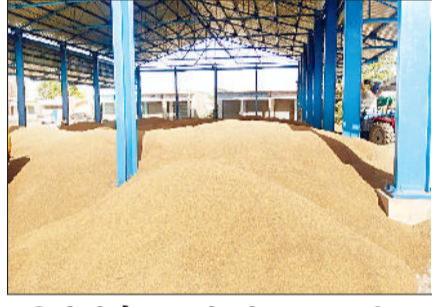
मंडियों में पैर रखने को जगह नहीं

नाच ना जानै, आंगन टेढ़ा वाला कहावत बाजरा खरीदने वाली एजेंसियों पर स्टीक बैठ रही है। सरकारी एजेंसियों ने एमएसपी पर बाजरे की खरीद 23 सितम्बर से शुरू करने का ऐलान कर दिया। खरीद केंद्रों पर बाजरे की खरीद की सारी तैयारी पूरी भी कर ली, लेकिन जब बाजरा खरीदने की बात आई तो खरीद एजेंसियों ने बाजरे की गुणवत्ता में कमी निकालना शुरू कर दिया। तब बाजरे की गुणवत्ता में कमी (कलर सही नहीं) बताकर खरीद से परहेज कर रही हैं। हालांकि सरकारी एजेंसियों के दावे के बाद किसानों ने अपनी फसल निकालकर मंडियों में डाल ली, लेकिन अभी तक उनकी फसल का एक भी दाना नहीं खरीदा गया है। जिस वजह खरीद केंद्रों पर बाजरे के बड़े ढेर लगे हैं। बाजरे की सरकारी खरीद शुरू नहीं होने के कारण किसानों को दिन रात अपनी फसल की रखवाली भी करनी पड़ रही है जिसके कारण खेत का काम प्रभावित हो रहा है।