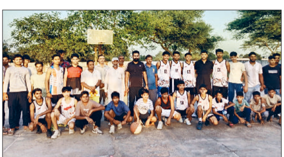
मिवानी। अतिथियों के साथ खिलाड़ी।