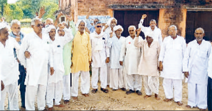
डिवीजन को देकर टेल तक पानी पहुंचाने के फैसले को प्रदेश कैबिनेट द्वारा बदल कर दोबारा सारी शक्तियां भिवानी मुख्य कार्यालय को सौंप दी हैं जिससे कृषि, घरेलू पेयजल आपूर्ति सिस्टम भी लड़खड़ाएगा। अधीक्षक अभियंता लोहारू जल सेवाएं मंडल भिवानी के कार्यालय 25 सितंबर को जारी पत्र में आदेश दिया गया है कि सरकार सिंचाई एवं जल संसाधन विभाग के अतिरिक्त मुख्य