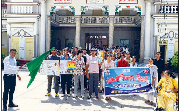
मिवानी। सड़क सुरक्षा पर जागरूकता रैली निकालते स्वयंसेवक।