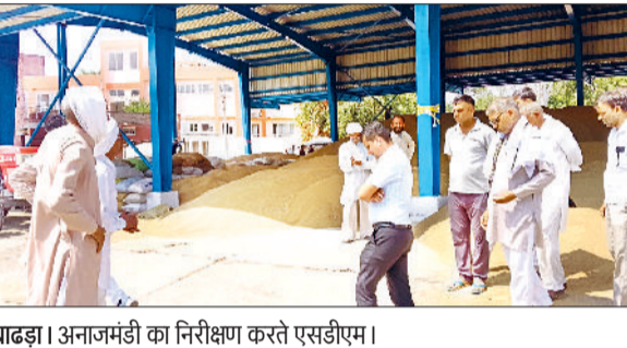
बाढ़ड़ा। अनाजमंडी का निरीक्षण करते एसडीएम।