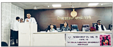
प्रशिक्षण शिविर को संबोधित करते वकता।